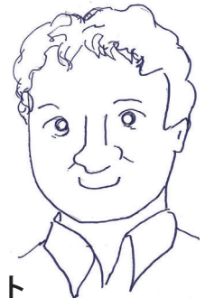
特別ゲスト 飯島滋明教授 名古屋学院大学