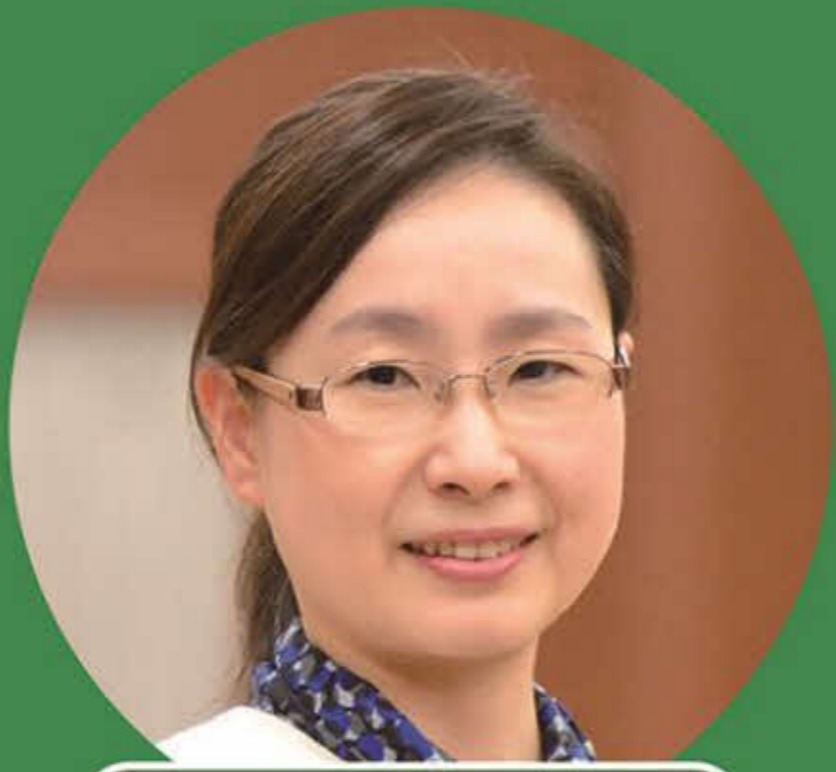
青井未帆(憲法研究者)