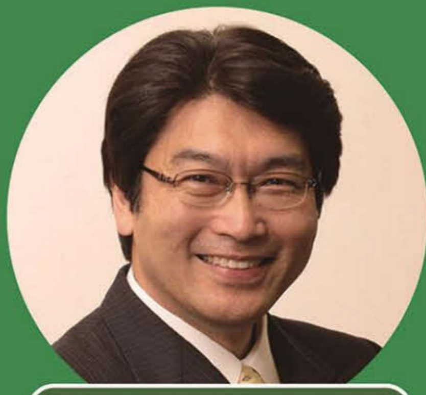
伊藤真(弁護士・伊藤塾塾長)