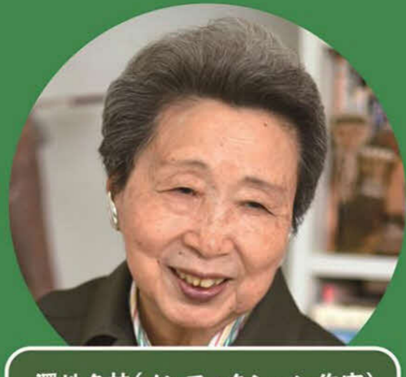
澤地久枝(ノンフィクション作家)