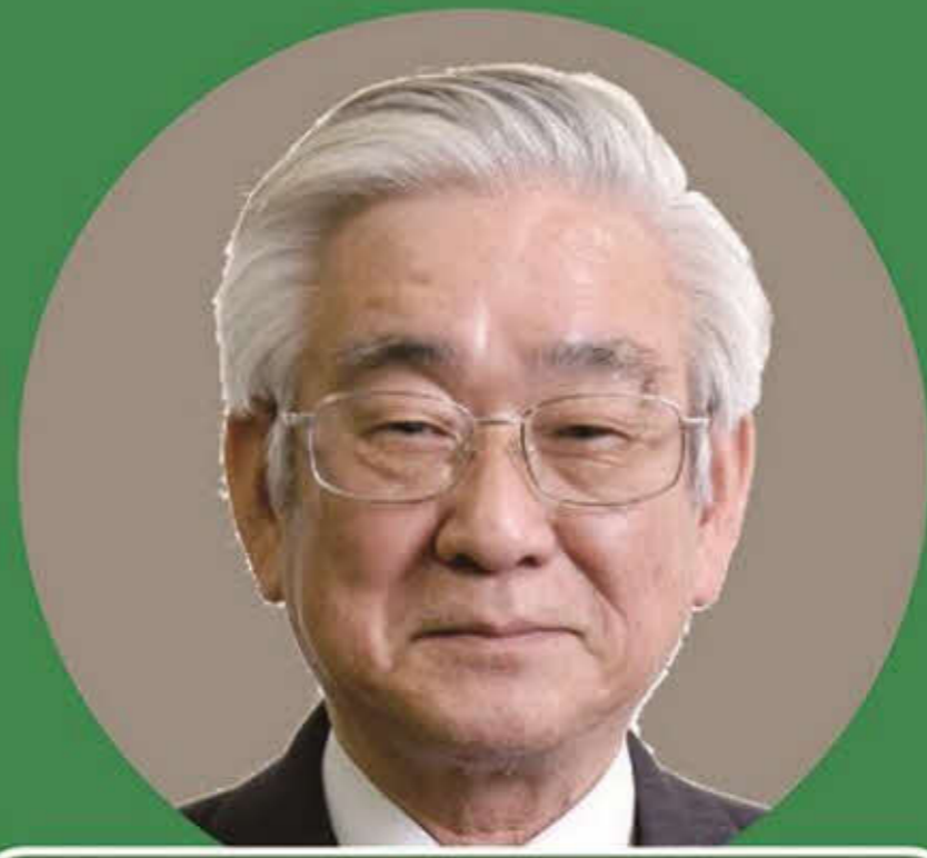
益川敏英(ノーベル賞受賞・物理学者)